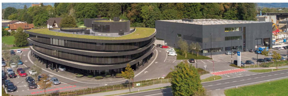
Maßgeschneidertes Büro-Trennwand-System für das Unternehmen Locker Recycling in Götzis.

Im Erdgeschoß befindet sich der Eingangsbereich mit Ausstellungs- und Besprechungsflächen, Schulungsraum und erforderlichen Sanitär- und Technikräumen sowie überdachten Autoabstellplätzen. In den Obergeschoßen sind Büroflächen, Mehrzwecksäle, allgemeine Flächen und Kommunikationszonen sowie erforderliche